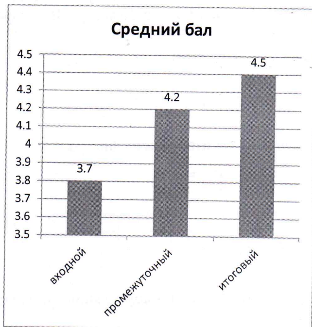
Диаграмма качества знаний учащихся 7«А» класса по Изобразительному искусству